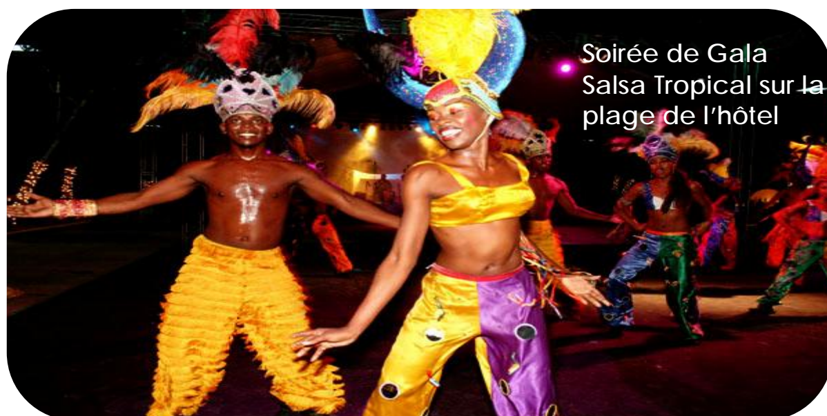
Soirée de Gala Salsa Tropical sur la plage de l'hôtel