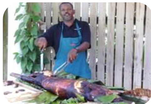
Robinsonnade sur une plage déserte Déjeuner barbecue sur la plage